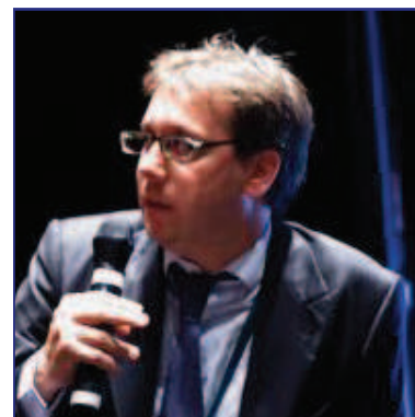
Alessandro Costa Direttore di Enel Foundation

Siamo arrivati anche alla seconda edizione del corso di formazione sull'evoluzione del sistema energetico mediterraneo , indirizzato a una ventina di funzionari pubblici del settore dell'energia provenienti da Paesi del Mediterraneo non appartenenti all'UE. Il corso è stato organizzato dalla Fondazione