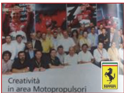
Creatività in area Motopropulsori

In Ferrari con un percorso di creatività gli ingegneri del gruppo motopropulsori sono riusciti a ridurre peso e costo del motore mantenendone la sua bellezza estetica, in Tenaris (Dalmine) hanno