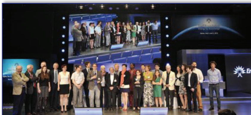
Prima conferenza internazionale di Enel Foundation, dal titolo "Energies for Future Urban Environment" (luglio 2013)